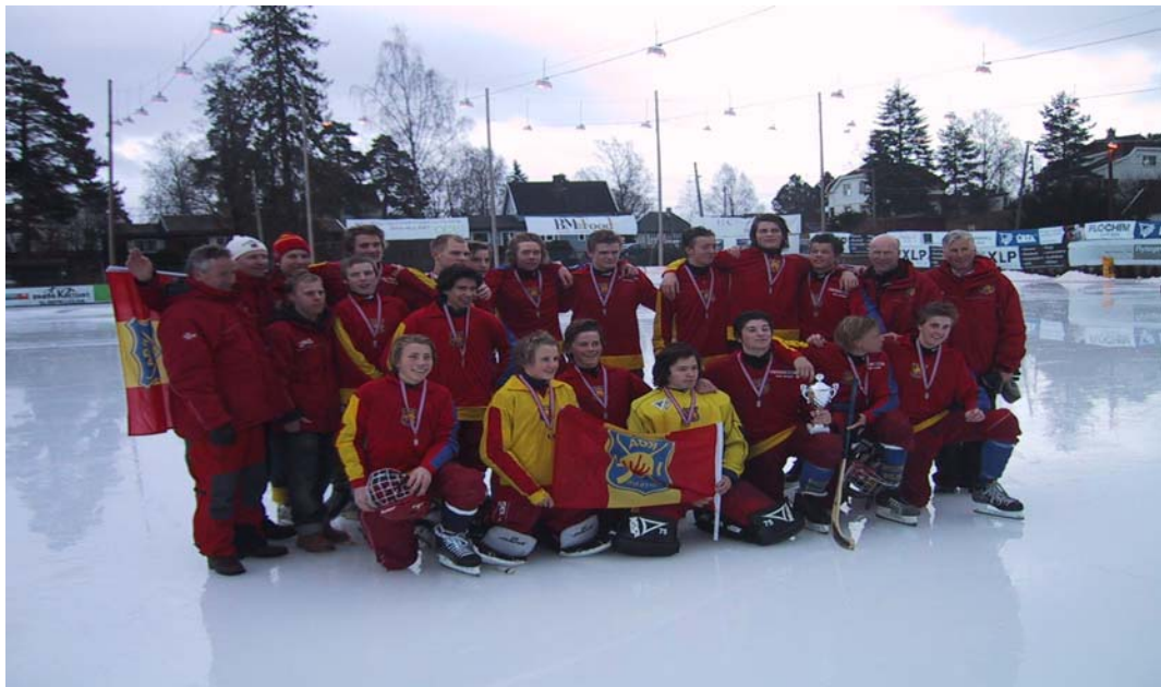
Norgesmester Gutt - Røa IL