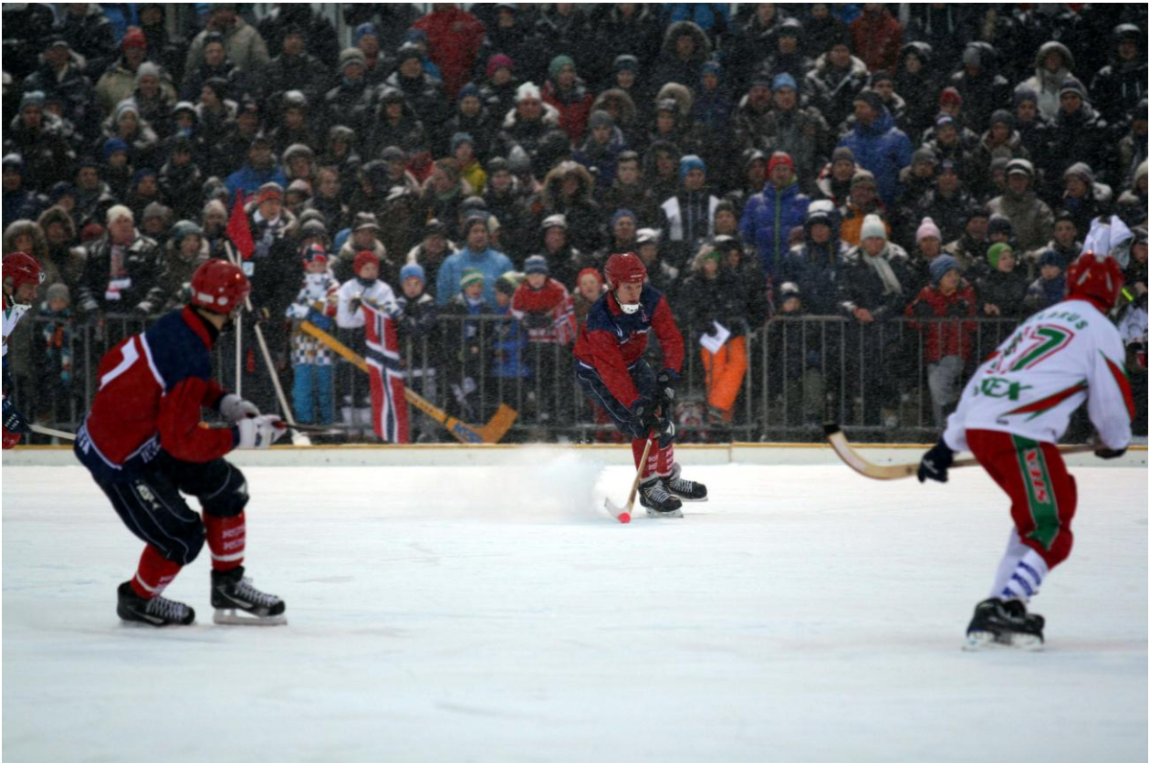
VM-kamp Norge – Hviterussland (5-2) på Frogner Stadion i Oslo søndag 27.januar 2013

Bandyseksjonens leder, samt generalsekretær og rekrutteringsansvarlig i NBF.