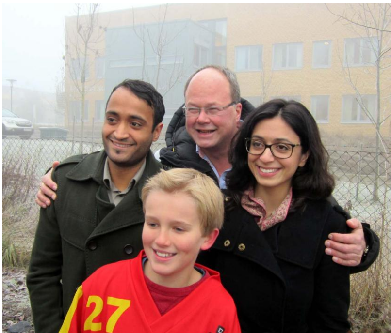
Kulturministeren overleverte 4.5 MNOK til Bogstad Vinterparadis

Prosjektet venter på tilgang til bevilgede midler fra Oslo kommune av fase 2. Planlagt åpning sesongen 2013/14.