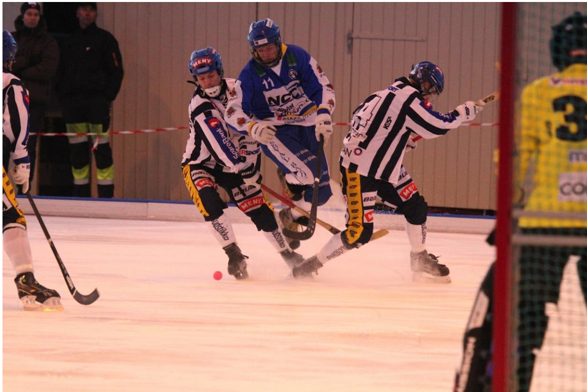
Fra NM-finalen 2013 på Stabekkbanen mellom Stabæk og Ullevål