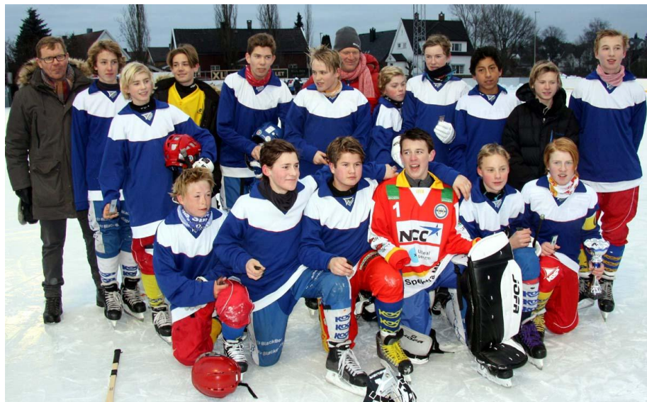
Bildet: Oslo smågutt 98