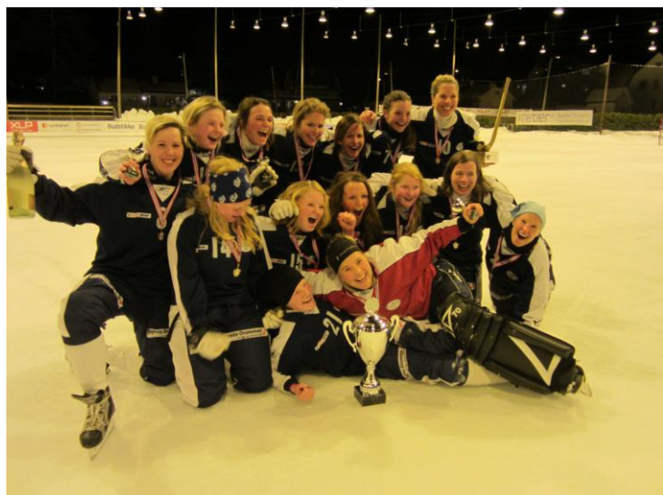
Nordre Sande/Drammen Bandy Norgesmester damer 2013

Private kamper og turneringer, som utgjør et betydelig kampantall, er ikke med i tabellen.