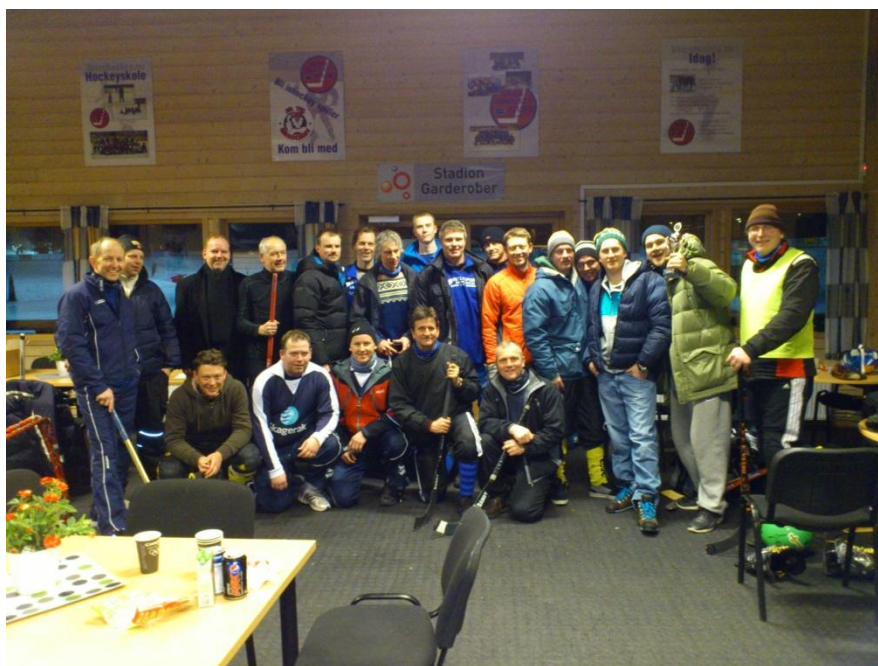
Deltakere i Grenland, lavterskeltturnering

Bandyen var helt tydelig savnet i distriktet. I etterkant av turneringen er det avholdt møter med Skien Fritidspark, Brevik IL, Skien Bandy og Larvik Bandy. Dette med bakgrunn i at NBF har planer om å få til en lokal tilpasset serie (turneringsform), i Grenland neste sesong. Vi jobber for at bandyen på nytt skal forankres i et tradisjonsrikt distrikt – og denne gangen for godt.