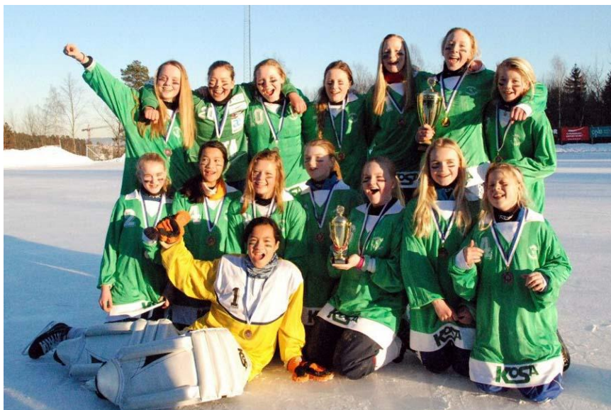
Bildet: Akershus jenter 97-99

Nr. 1: Akershus, nr.2: Oslo, nr.3: Buskerud