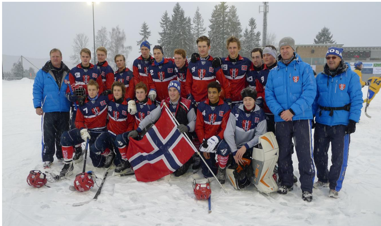
Norge U19 tok sølv i både Nordisk Mesterskap og European Tournament 2013 (se egen rapport)