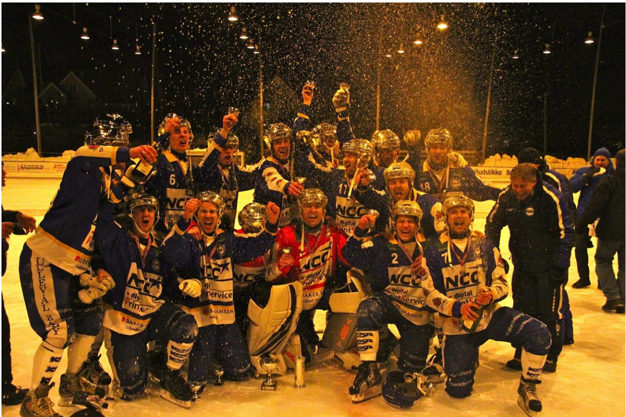
Ullevål IL Norgesmester herrer 2013