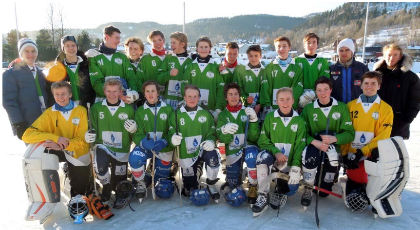
Bildet: Akershus gutt 97

Nr. 1: Akershus, nr.2: Oslo, nr. 3: Buskerud