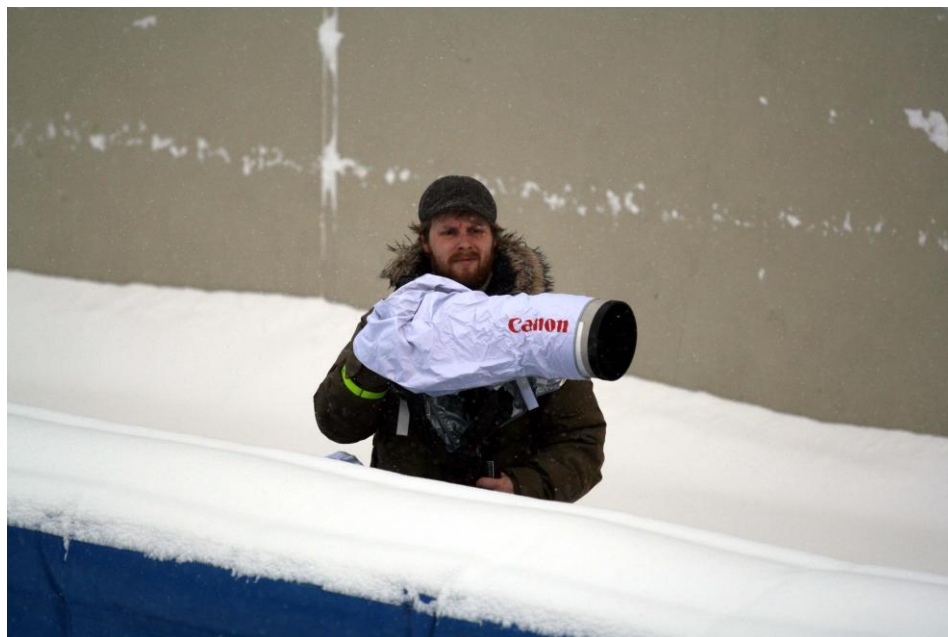
Fra VM-kampen på Frogner Stadion

For å få gjennomslag i media, er det viktig med godt besøkte kamper på disse dagene. Hvordan det bør løses i forhold til geografi og motstandere er ett politisk spørsmål bandyen løpende tar stilling til.