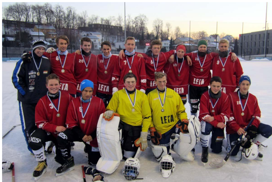
Bildet: Buskerud gutt 96

Nr. 1: Buskerud, nr.2: Oslo, nr.3: Akershus