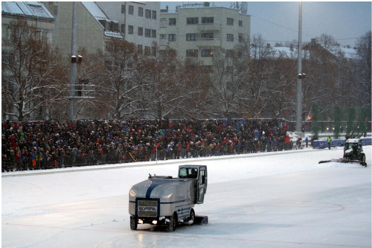
Fra VM-kampen på Frogner Stadion