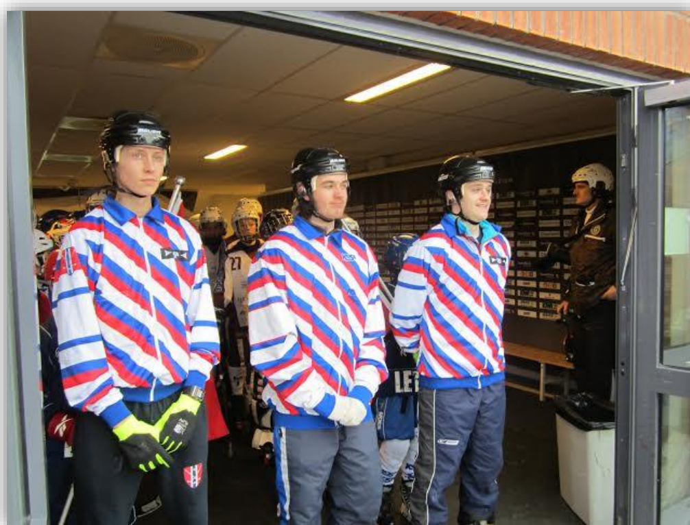
Fra NM/ET U17 Drammen