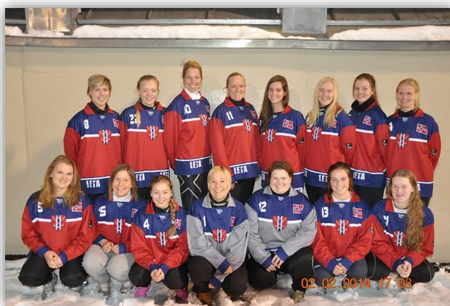
VM- laget i Lappeenranta 2014

NBF ved Bandyseksjonen har vedtatt å slå sammen Jens B. Raanaas Minnefond og Ballfondet i ett felles fond som blir hetende Jens B. Raanaas Minnefond og Ballfond.