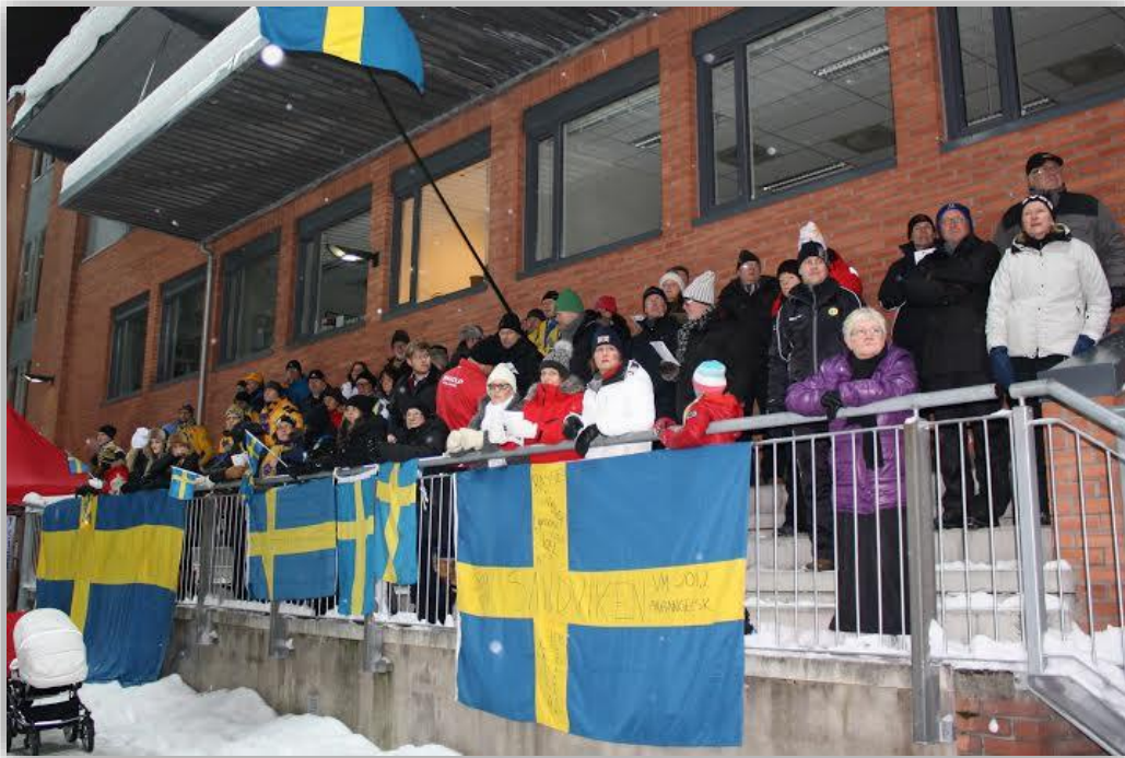
Fra NM/ET U17 gutter Drammen 2014

Spillere som blir norgesmestere i herre- og dameklassen tildeles NBFs gullmedalje, NBFs norgesmesterskapsmerke og NBFs norgesmesterdiplom. Således virker det unødvendig med utdeling av et miniatyrbeger i tillegg.