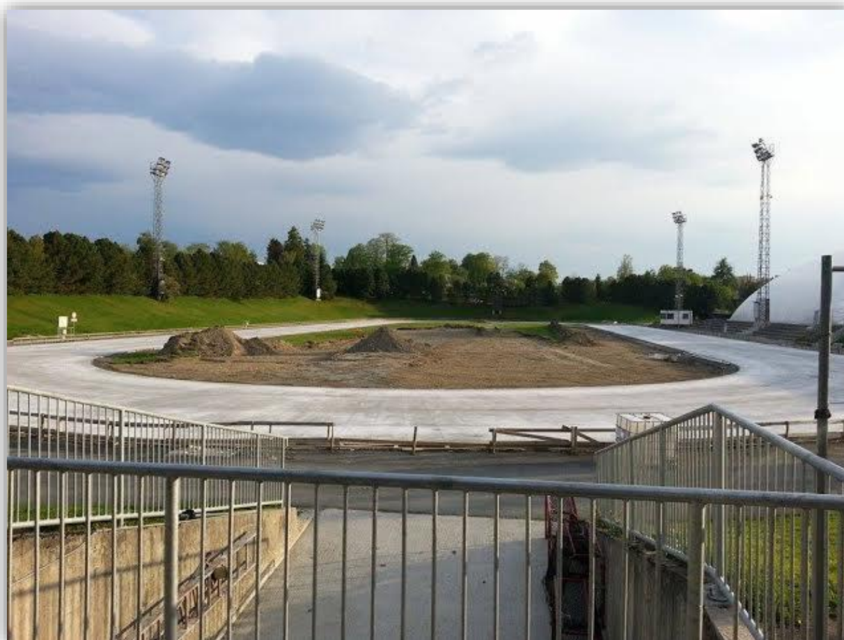
Kunstisarbeidet er i gang på Leangen i Trondheim

Sum sponsorinntekter kr. 60.000 tilskrives sponsoravtalen med Leta AS. Følgende firmaer gav betydelig reduserte priser/gaver knyttet opp mot arrangement av hjemlige mesterskap: Norgesbuss, Thon Hotels Ullevaal Stadion, Haraldsheim Vandrerhjem Oslo, First Ambassadeur Hotel Drammen. Ski og Ballklubben Skiold, Ullevaal Stadion AS, Aass Bryggeri. Verdien av reduserte priser/gaver kan estimeres til ca. 60.000 kroner.