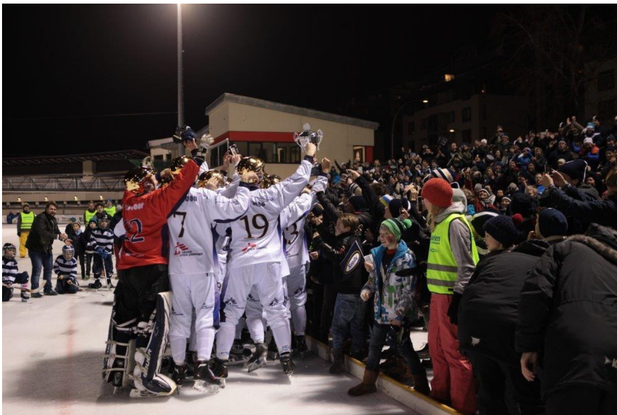
Årets Norgesmester Ready tilbake til finalespill på Frogner Stadion etter 100 års fravær.