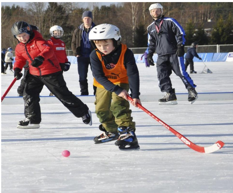
Bandydagen på Jevnaker var populært.

NBF ved Bandyseksjonen har tidligere vedtatt å slå sammen Jens B. Raanaas Minnefond og Ballfondet i ett felles fond som blir hetende Jens B. Raanaas Minnefond og Ballfond.