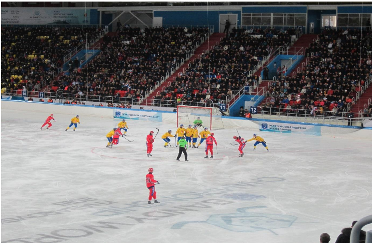
VM-finalen 2015 i Erofei Arena, Khabarovsk: Russland 5 – Sverige 3. Tilskuere: 10.000

Drammen vgs. har siden 2006 hatt tilbud om bandylinje. I år har det studert 10 elever fordelt på tre klassetrinn, hvorav to jenter. To elever i 1.klasse, tre elever i 2.klasse og fem elever i 3.klasse.