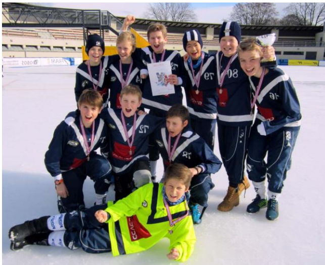
Årets vinner gutter: Slemdal skole, Oslo