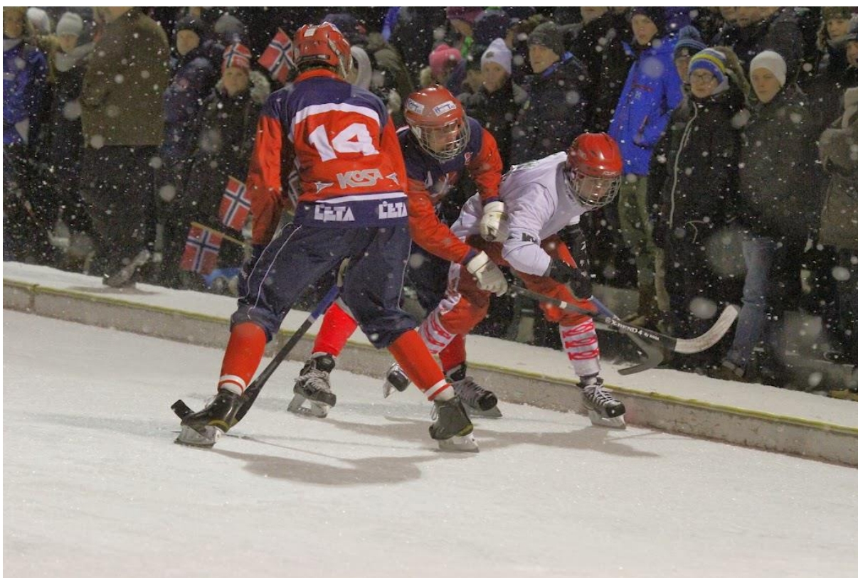
Bildet: Fra VM U19 i Oslo 2014.