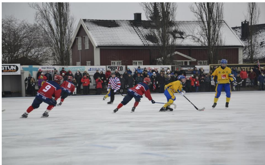
VM U17 gutter Sarpsborg: Bronsefinalen Norge-Sverige.

Treningskamp aldersbestemte landslag: Honorar: Gjennomsnittet av satsen for landslagsklassen og divisjonssatsen.