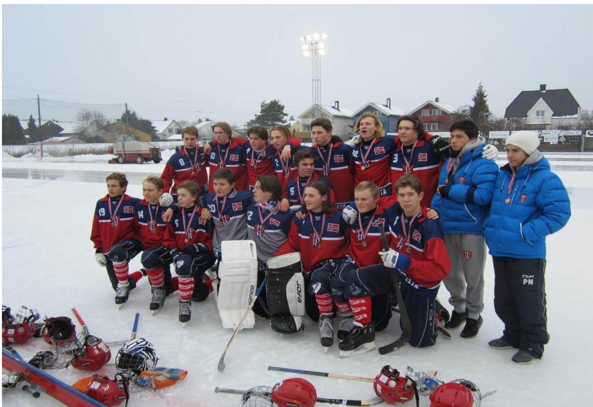
Norge U17 ble nr. fire av seks deltakende nasjoner.