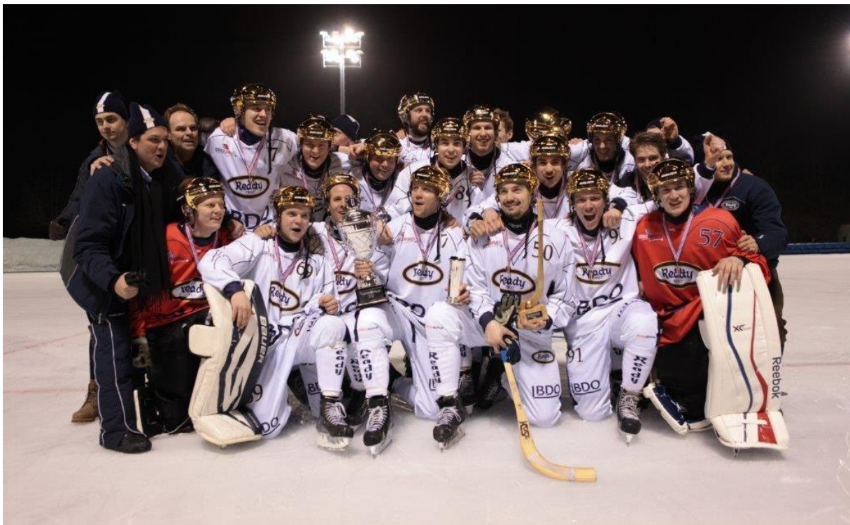
Norgesmester herrer 2015 - Ready

De senere årene har Ballfondet bestått av Bandyseksjonens valgte leder, NBFs Generalsekretær og Bandyseksjonens rekrutteringsansvarlige, som oppnevnes når den nye Bandyseksjonen konstitueres. Samme ordning foreslås for kommende periode.