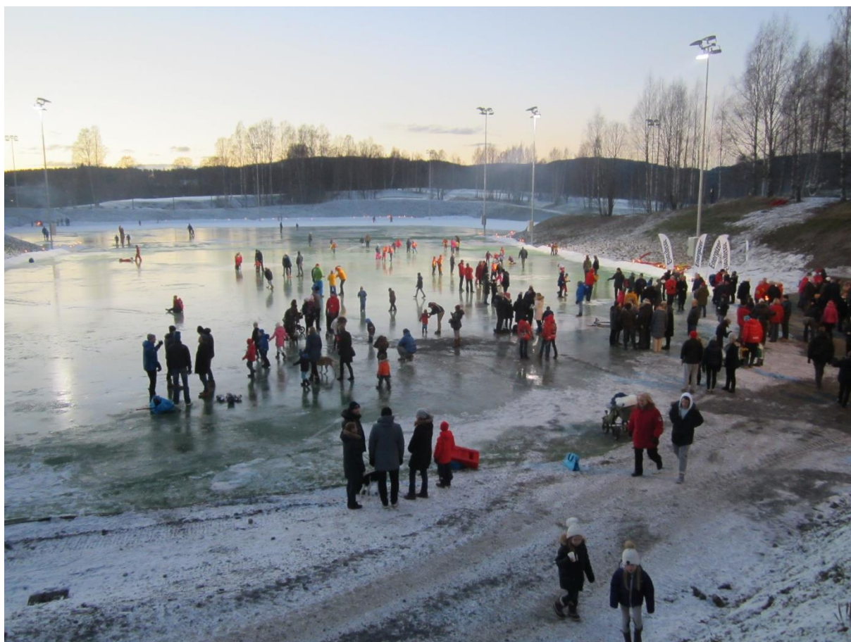
Fra den formelle åpningen av Bogstad Vinterparadis på Røa 13. desember 2014.