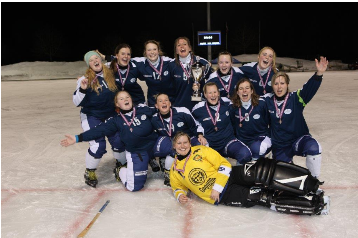
Norges- og seriemester damer 2014/15 - Nordre Sande/Drammen.

Endring fra best av 5 til best av 3 kamper.