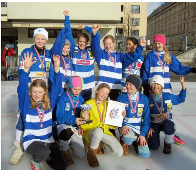
Årets vinner jenter: Høvik verk skole, Akershus.

Deltakende guttelag: Stabekk skole, Konnerud skole, Slemdal skole