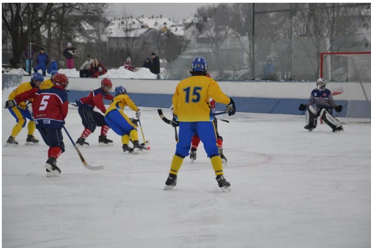
Fra bronsekamp VM U17 Sarpsborg 25.januar 2015: Norge – Sverige, 1-11.

Det gjøres oppmerksom på at Norges Bandyforbunds regnskaper for siste regnskapsperiode er ikke ferdig revidert eller endelig fastsatt av forbundsstyret. Det kan derfor bli mindre endringer i seksjonens endelige aktivitetsregnskap.