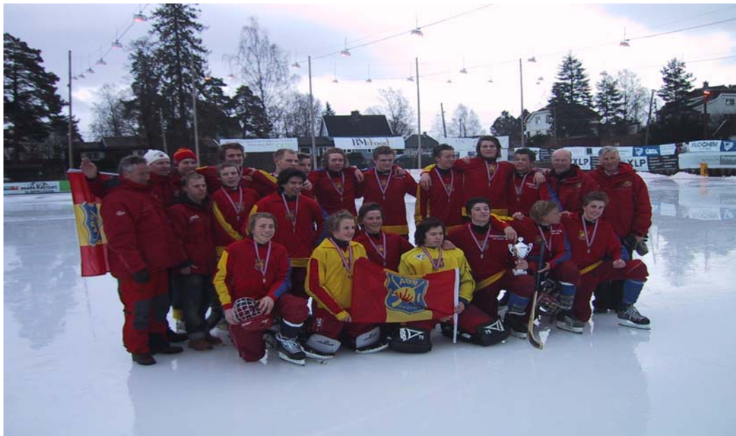
Norgesmester Gutt - Røa IL