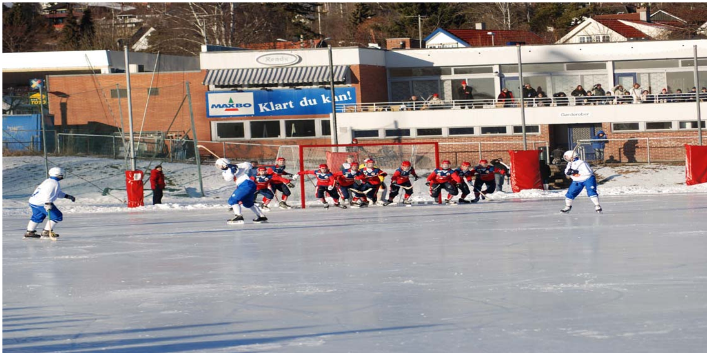
Nordisk U17 - Gressbanen