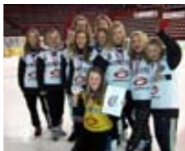
Solberg skole jenter