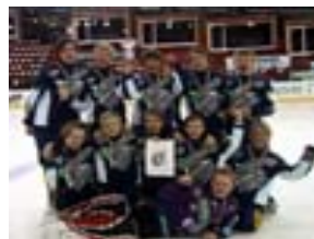
Hosle skole gutter