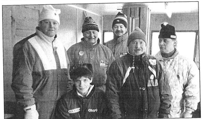
... og i Svenska Skidspelel.