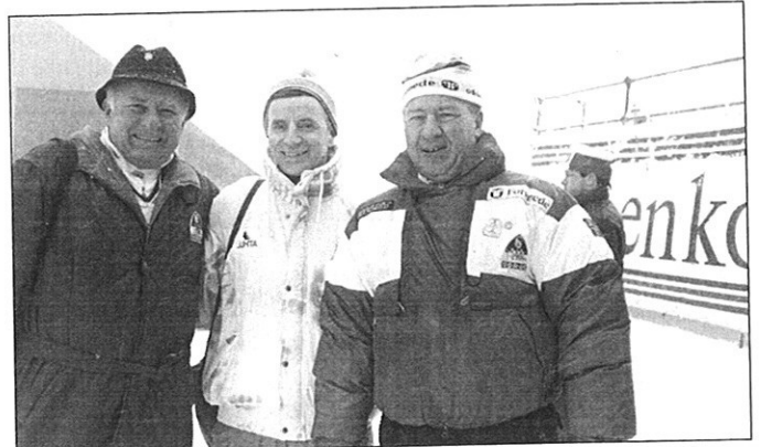
... i Holmenkollen...